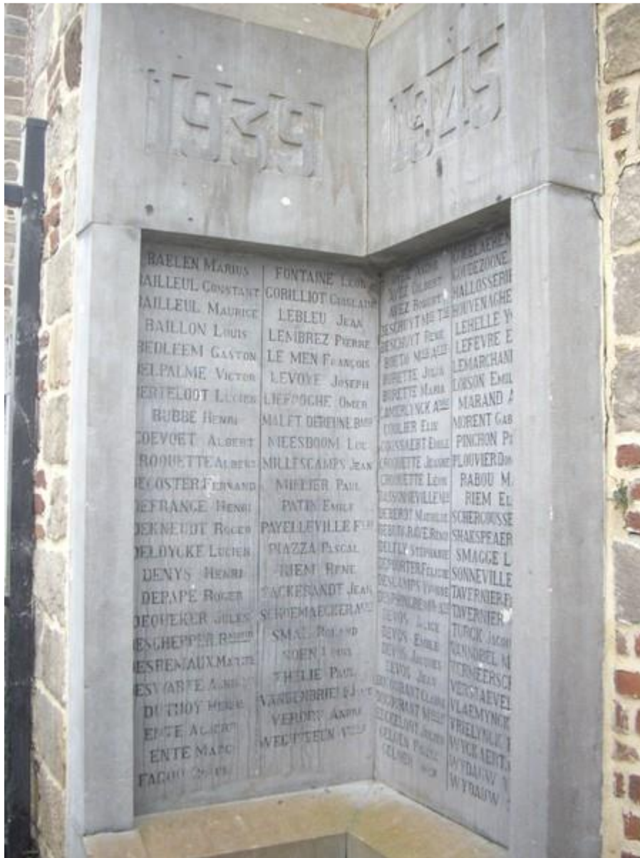
Monument aux morts de Bailleul 59270

On ne vit pas avec les morts. On meurt avec eux ou on les fait revivre ; Ou bien, on les oublie. Louis Martin-Chauffier.